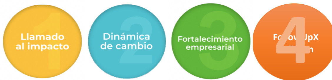
Figura 2. Fases Generales del programa

A continuación, se encuentran relacionadas las actividades a desarrollar en cada fase del programa.