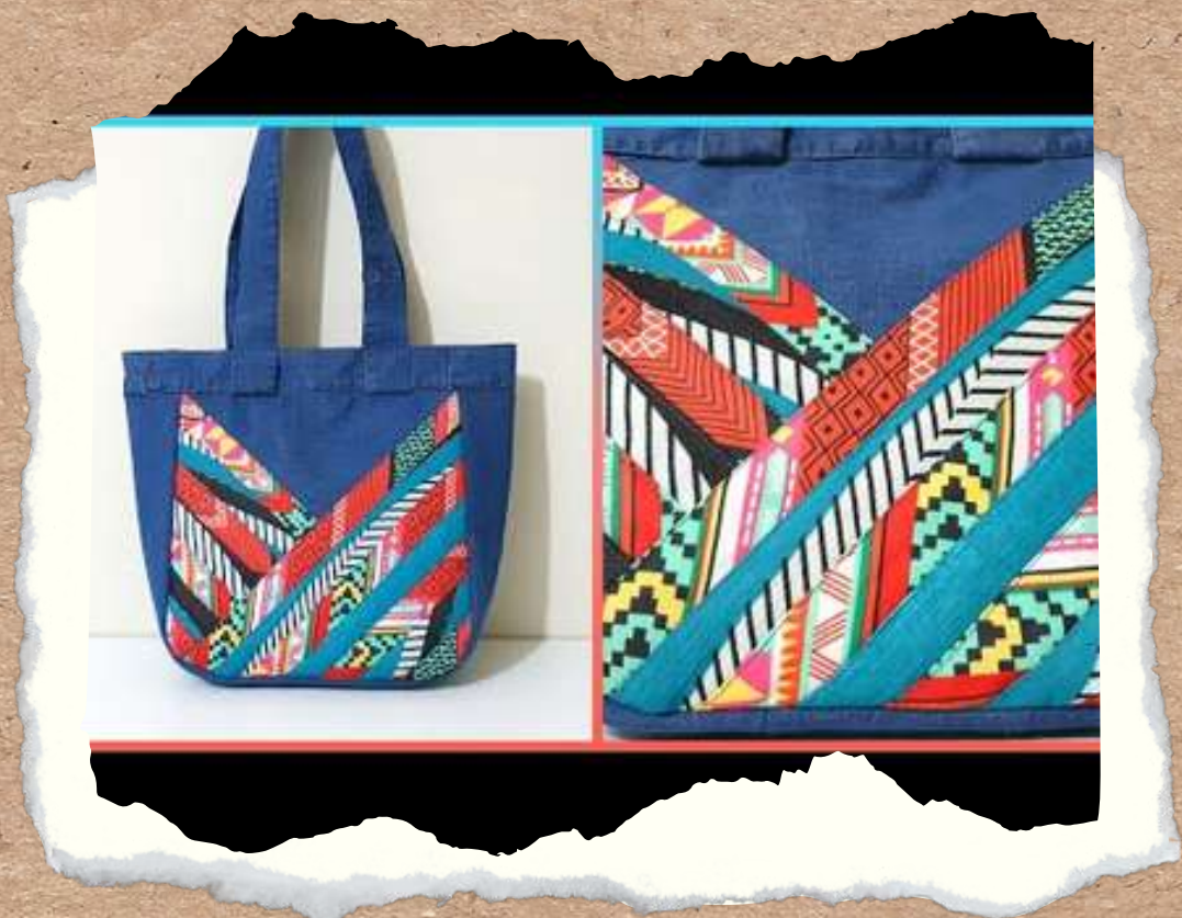
BOSOS DE MANO