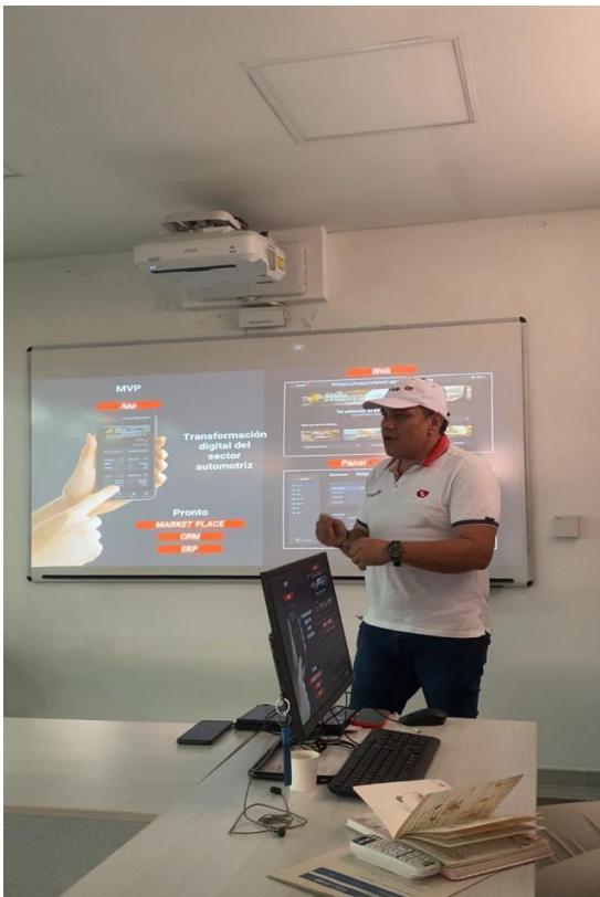
NOVIEMBRE 8 JUNTA DIRECTIVA