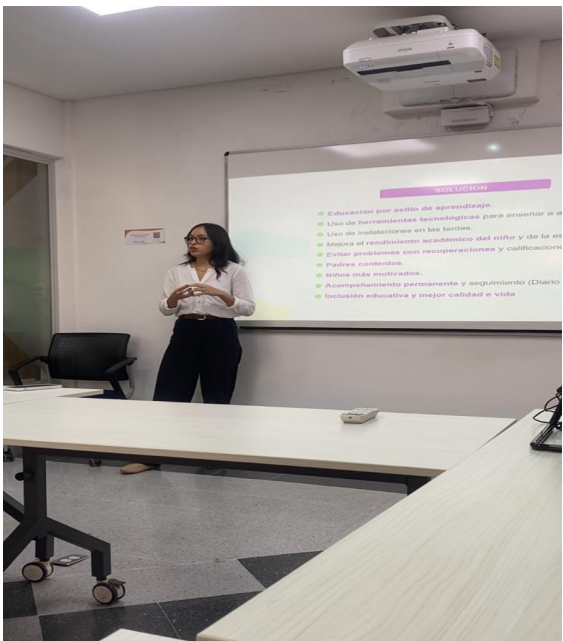
NOVIEMBRE 8 JUNTA DIRECTIVA